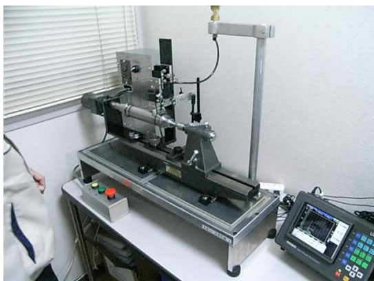
超音波探傷検査装置