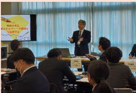
指導者からの指導・講評