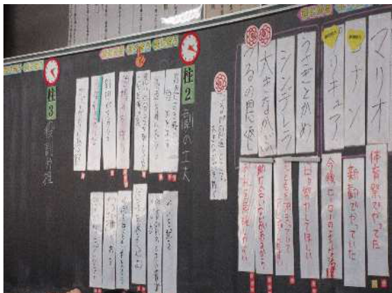
出し合う、比べ合う、まとめるの流れで合意形成を図る学習過程