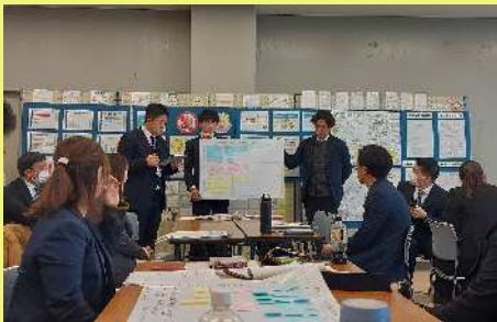
各班の協議内容の発表