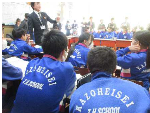
安心して自分の考えを述べられる学級経営