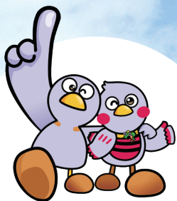
埼玉県マスコット 「コバトン」「さいたまっち」