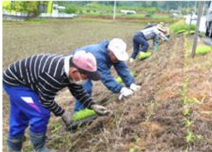
( 法面にセンチピード )