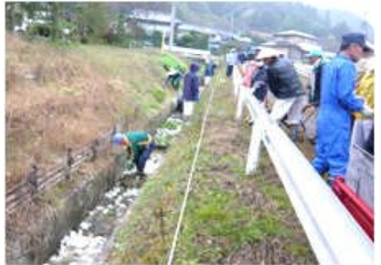
( 水路に石灰石投入 )