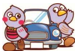
さいたまっち コバトン