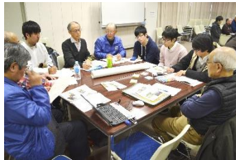
令和元年度 川の再生交流会の様子

◆令和 3 年度 開催予定 令和 4 年 2 月 5 日（土）埼玉会館 ※新型コロナウイルス感染症拡大防止のため令和 2 年度は開催を中止しました。