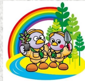
大会シンボルマーク