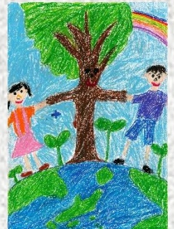
大会ポスター原画