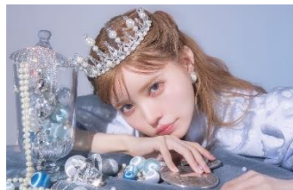
ますわか 益若 つばさ さん