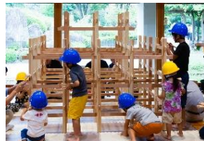
木製ジャングルジム組立体験

森林・林業に関する展示ブース、木に触れて楽しめる ワークショップ、全国植樹祭に関するクイズラリーなどを実施