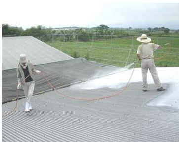
石灰の吹き付け（宮崎県）