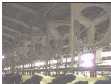
換気扇による送風（福井県）