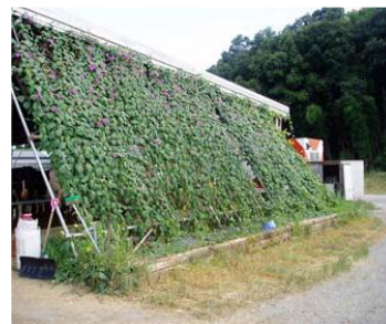
ネットに植物を這わせる（兵庫県）