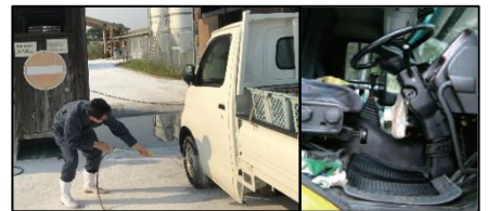
車両はタイヤだけでなく、 泥よけの内側まで消毒 し、 フロアマットの交換 や ペダル等車内も消毒