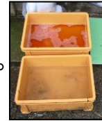
推奨される踏込消毒槽の設置方法！