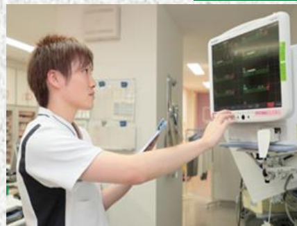
県立病院における看護現場