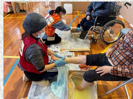
能登半島地震での 災害支援ナースの活動