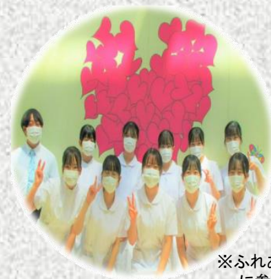
※ふれあい看護体験 に参加した学生