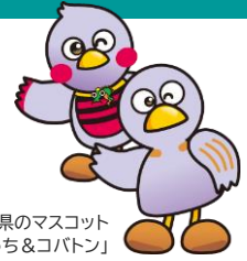
埼玉県のマスコット 「さいたまっちゃん＆コバトン」

受付:月～金曜日9:00～12:00、13:00～16:30(祝・休日、年末年始を除く)