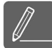
持参した鉛筆の 使用が可能