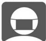
スタッフのマスク着用