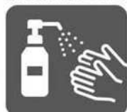
アルコール消毒液 の設置