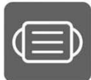
マスク着用 (咳エチケット)