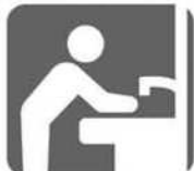
来場前後の手洗い