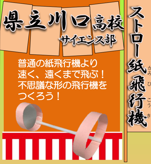
Paper airplanes using straws