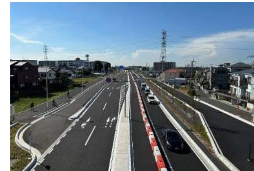
整備状況 国道254号（和光富士見バイパス）