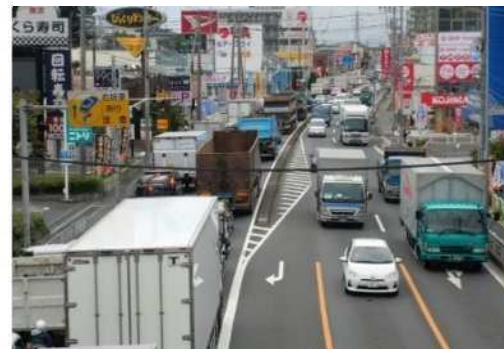
現道の渋滞状況 国道254号（新座市内）