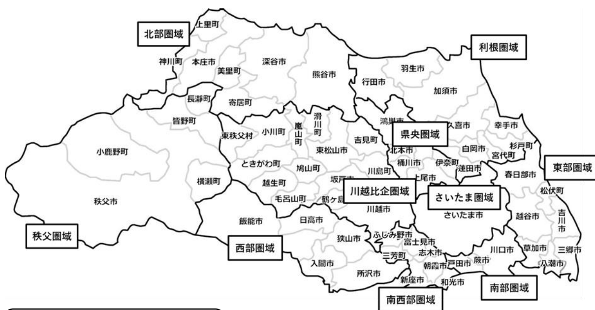
老人福祉圏域の状況