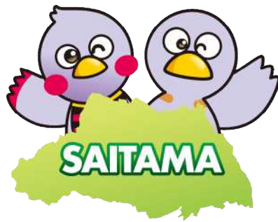
埼玉県マスコット さいたまっち&コバトン