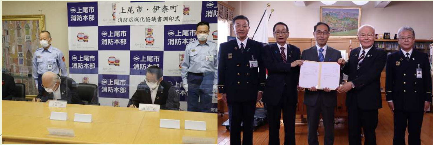
上尾市・伊奈町消防広域化運用開始式（令和5年4月1日）