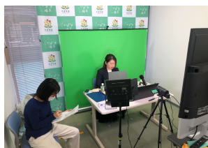
オンラインスタジオの様子