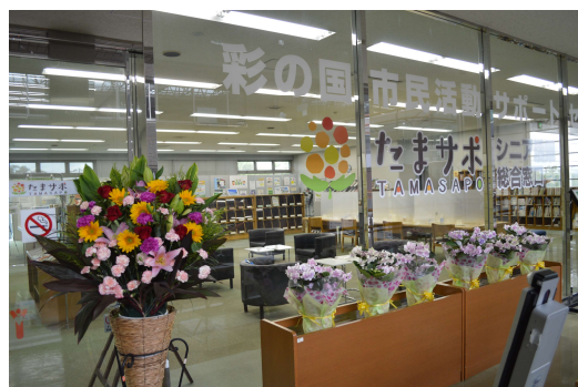
たまサポ （彩の国市民活動サポートセンター）