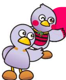
コバトン&さいたまっち