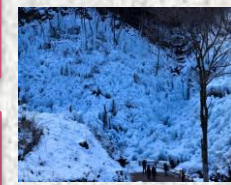
あしがくぼの氷柱