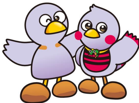
埼玉県のマスコット 「コバトン・さいたまっち」