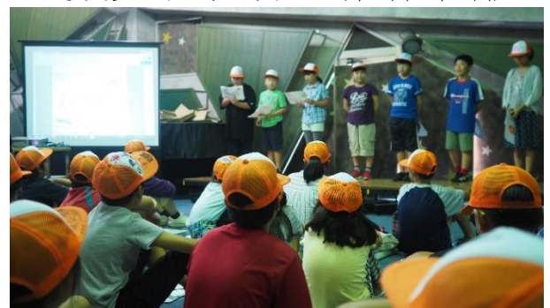
長瀬ワクワク体験キャンプ (7/24(水)～7/28(日))