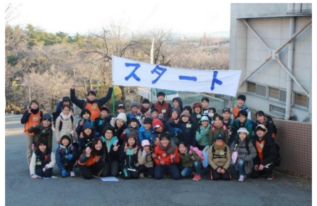
神川ネイチャーキッズ⑤ファイナルチャレンジ！～仲間と歩む20km～！