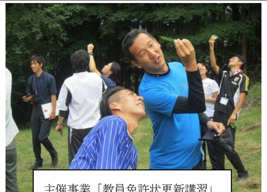
主催事業「教員免許状更新講習」