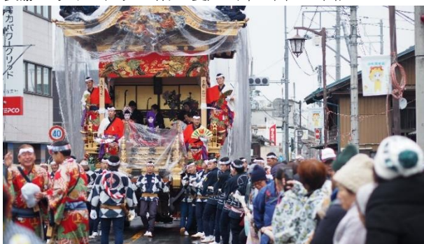
ユネスコ世界無形文化遺産登録秩父夜祭 (12/2(月)～3(日))