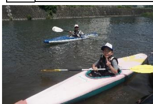
主催事業「すばる探検隊」