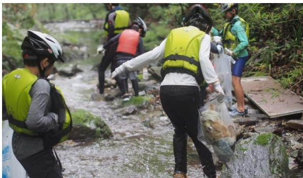
長瀬ぼうけんクラブ(春・夏)2 (6/15(土)～16(日))