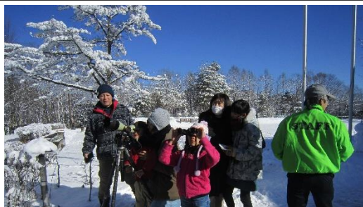
主催事業「メープルパンケーキでティータイム・バードウォッチング・三十槌氷柱見学・ずりあげうどん作り」