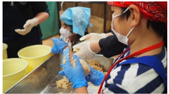
秩父の6次産業を知ろう！ (1/25(土)～1/26(日))