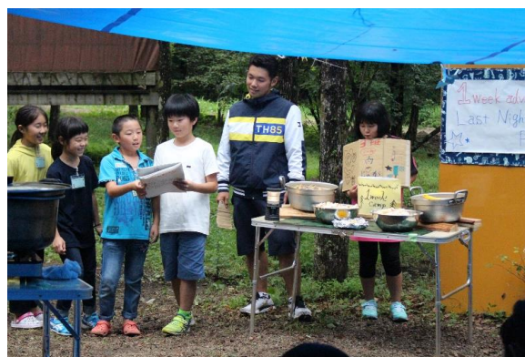
神川サマーキャンプ 1week adventure