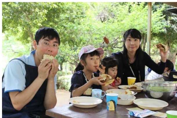
ハンバーガーセットを作ろう！開店！神ドナルド！