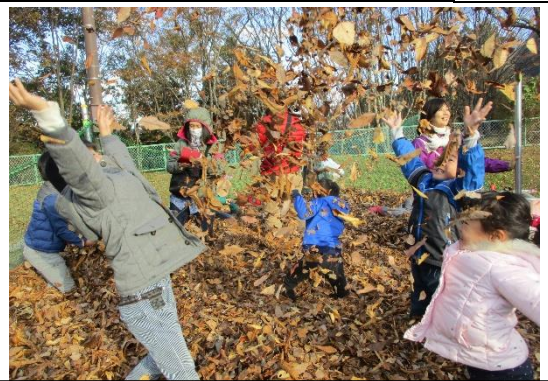
主催事業「落ち葉のプール・焼きいも・ドラム缶ピザ作り」