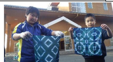
主催事業「山のピザ工房～ピザづくりと草木染め体験～」