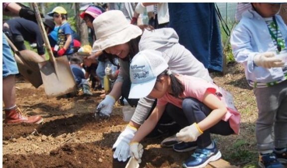
春だ！ちびっこ大集合 (5/4(土)～5/5(日))