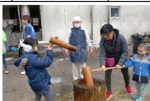
主催事業「げんきプラザでお正月！」