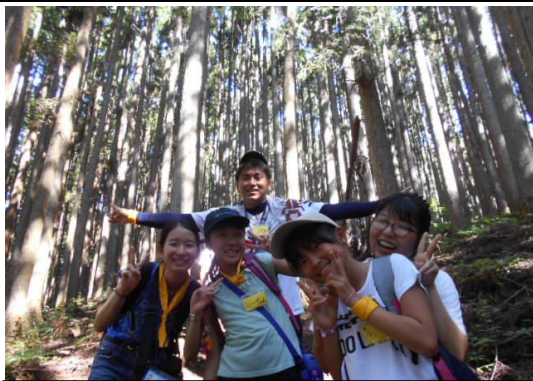
主催事業「大滝チャレンジスクール2019」