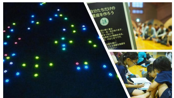
ふれあいファミリーキャンプ (6/22(土)～6/23(日))