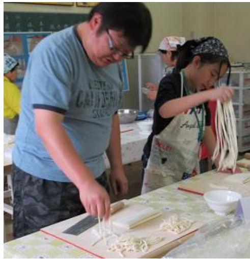
はじめての手打ちうどん体験（加須げんきプラザ）