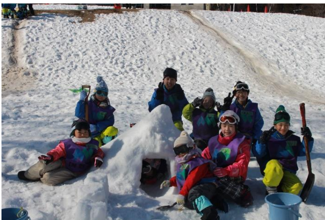
神川ウィンターキャンプ～思いっきり雪遊び～