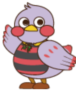
埼玉県のマスコット「さいたまっち」