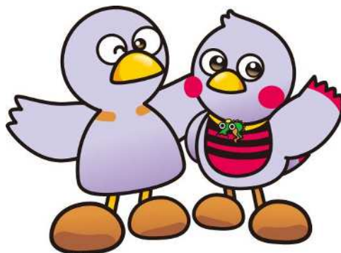
埼玉県のマスコット 「コバトン・さいたまっち」