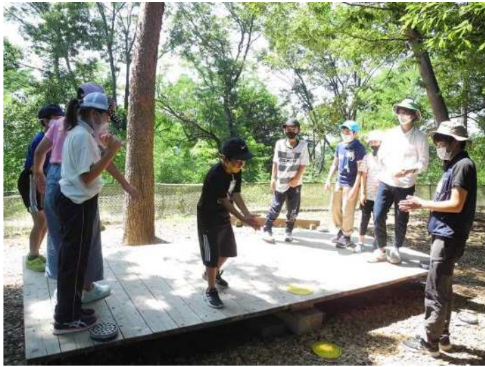
(ネイチャーキッズ第2回 アドベンチャー教育プログラム 神川げんきプラザ)