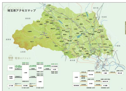
アクセスマップページ