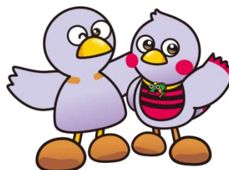
埼玉県のマスコット「コバトン」「さいたまっち」

※ 提出期限後に提出された申請については、認定審査を行いません。奨学金を希望する場合は、期限内に申請書類の提出をお願いします。