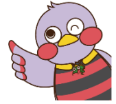
Maskot ng Saitama "Saitamatch"

Sa Saitama prefecture may mga nakahandang sistema para gumaan ang gastusin at para sa scholarship loan na walang interes para sa mga estudyanteng papasok sa senior high school. Tingnan sa ibaba ang detalye ng mga nilalaman at paraan ng pag-aaplay.