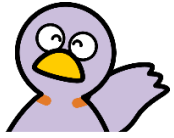
Maskot ng Saitama "Kobaton"