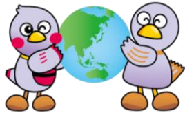
埼玉県マスコット 「さいたまっち&コバトン」