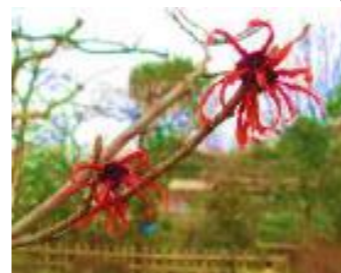
アカバナシナマンサク