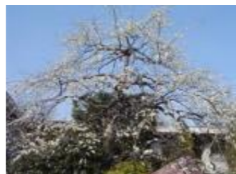
あゆみ野農協安行園芸センター