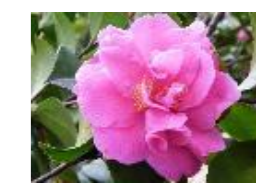
フレグランスピンク