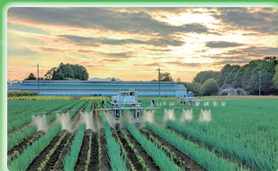
(株)レグミンアグリサービス