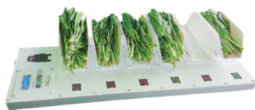
(株)オーケープランニング