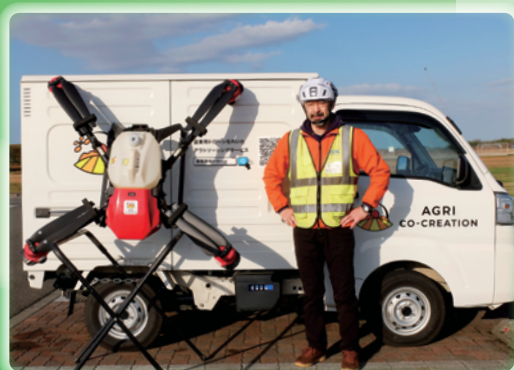
アグリ コ・クリエーション