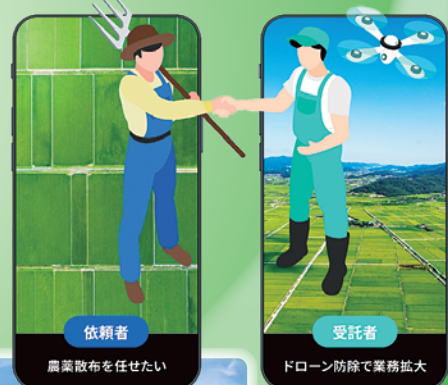
(株)ナイルワークス