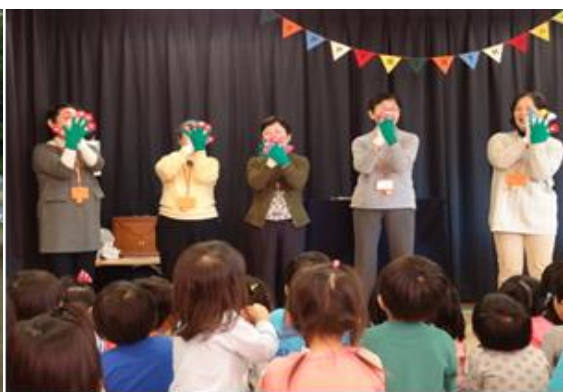
おはなしボランティア 「まっぼっくり」（草加市）