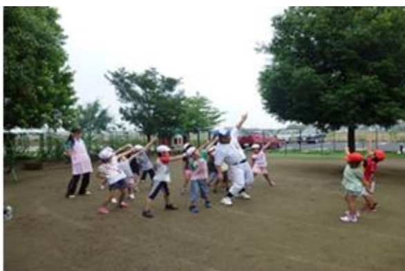
熱いぞ！熊谷からの野球教室 （本庄市）