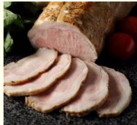
彩の国黒豚のロースト