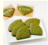
氷川の杜サブレ （狭山抹茶）