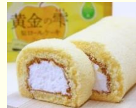
黄金の雫 梨ロールケーキ