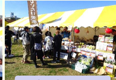
県産農産物の販売