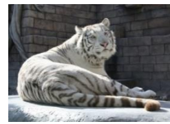
東武動物公園(宮代町)