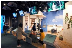
SKIPシティ映像ミュージアム(川口市)

NEW SHUTTLE Saitama New Urban Transit Co., Ltd.