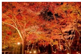
月の石もみじ公園(長瀬町)