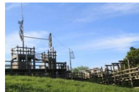
みさと公園(三郷市)