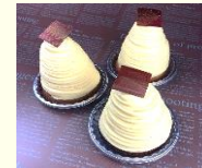
川越芋の 「いもンブラン」