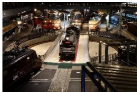
鉄道博物館(さいたま市)