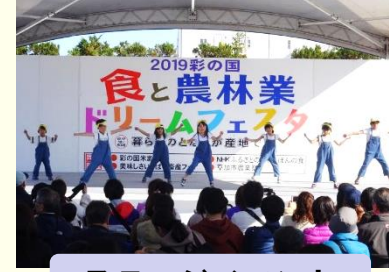
ステージイベント