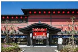
西武秩父駅前温泉 祭の湯(秩父市)