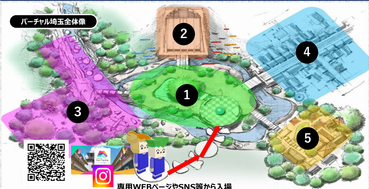
バーチャル埼玉全体像

対応機種 PC、スマートフォン等 (iOS,Android対応、一般的なブラウザで動作し、会員登録やアプリのダウンロードは不要)