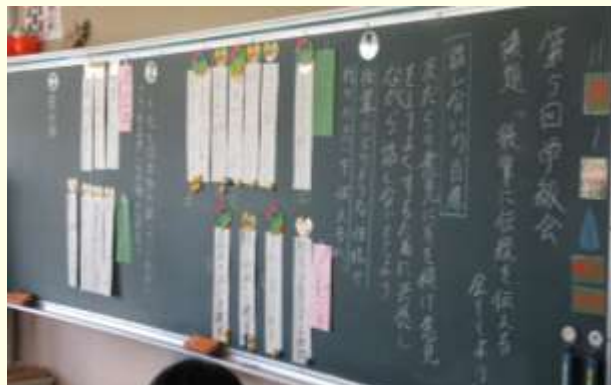
計画委員による適切な事前準備により、スムーズな進行、整理された板書が見られた。