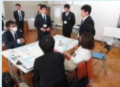
『私の授業の観てほしいポイント』に沿った研究協議