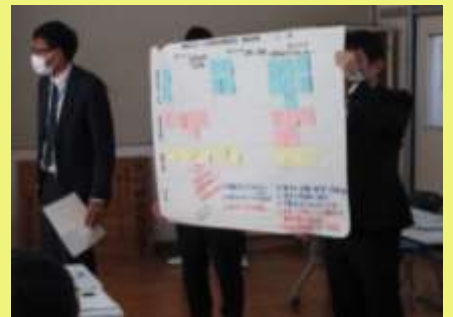
各班の協議内容の発表