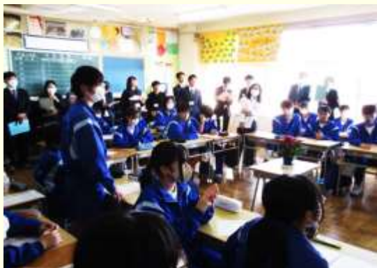
提案理由に基づいて、様々な立場から意見を考え発表する生徒の姿が見られた。

内容(1) 学級や学校における生活づくりへの参画 ウ 学校における多様な集団の生活の向上