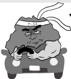
歩行者優先イメージキャラクター「さいたまお父さん」