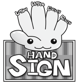
道路横断時の安全行動イメージキャラクター「サイン(SIGN)ちゃん」