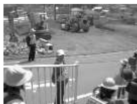
[登下校時の見守り]