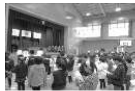
「ふれあい推進長紹介式」

「ふれあい推進長紹介式」では、PTAにも参加をしていただき、合唱と合奏をして感謝の気持ちを表した。