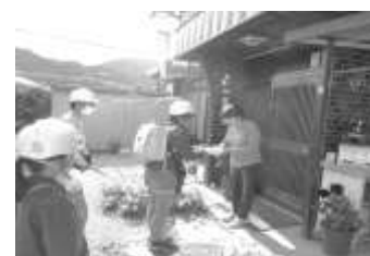
「子ども110番の家」お礼訪問

学区には、23軒の「子ども110番の家」が登録されており、子どもたちの安全を見守ってくれている。5月には、全校児童が、各通学路や近所の「子ども110番の家」