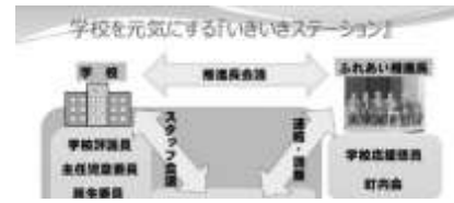
「いきいきステーション組織図」

学校と地域では、ふれあい推進長が月1回の「推進長会議」で学校行事や校内の環境整備等について確認を行い、そこから学校応援団員の方々への連絡調整、教育活動への協力をいただいている。また、学校とPTAにおいては、月に1度の「スタッフ会議」を通して活動や行事の確認を行い、協力をいただいている。地域と家庭との連携においては、PTAから学校応援団員として参加をしていただいたり、親父の会の活動に学校応援団員の方々にも参加をしていただいたりするなど、それぞれの結び付きを強めた。