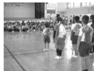
伝統芸能「カンカチ」の披露

「カンカチ」は地域の方からの提案により教育活動に取り入れることになった。運動会や、横浜の間門小交流会で披露している。練習のときは、渡瀬小学校の卒業生が来て踊りを教えてくれる。カンカチについて、学校運営協議会でも話題になり、交流会では、衣装の着付けや篠笛の演奏で、地域の方々が手伝ってくれた。伝統芸能のことを子どもたちに知ってもらいたいという家庭・地域の願いと、地域の伝統を教育活動に取り入れたいという学校の願いが一致したケースといえる。