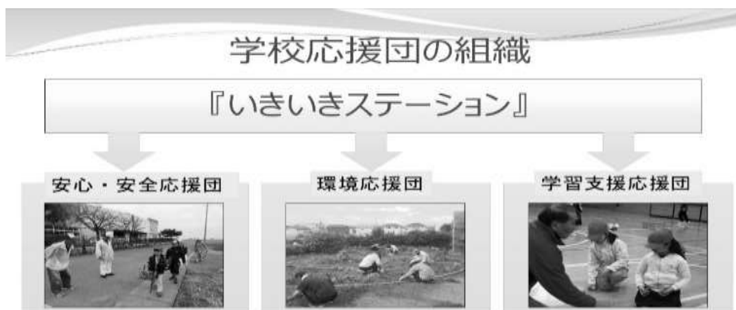
「学校応援団組織図」