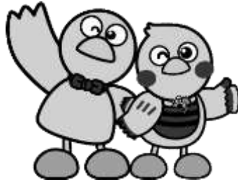
埼玉県のマスコット「コバトン」「さいたまっち」