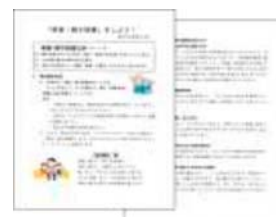
「学校運営協議会だより」の発行

(3) 児童の学習の場・コミュニケーションの幅が広がり、表現も豊かになってきた。地域に対する愛着や誇りが育ち始め、自信につながってきている。