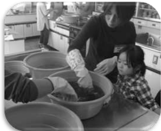
【草木染】 親子で体験！楽しい草木染