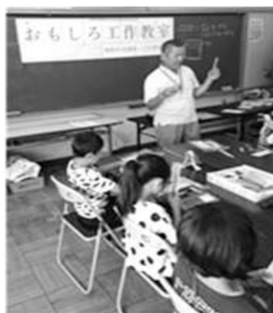
【ハサミの使い方】 細かいところも切れるようになりました