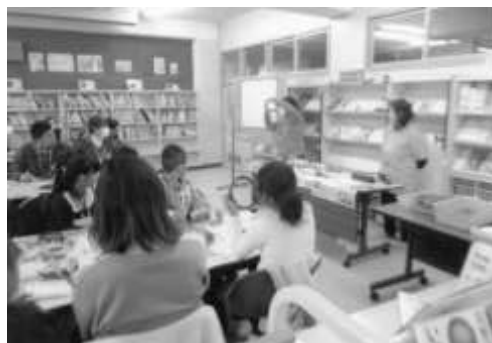
【お楽しみ♪体験教室】 リース作りを体験しました♪