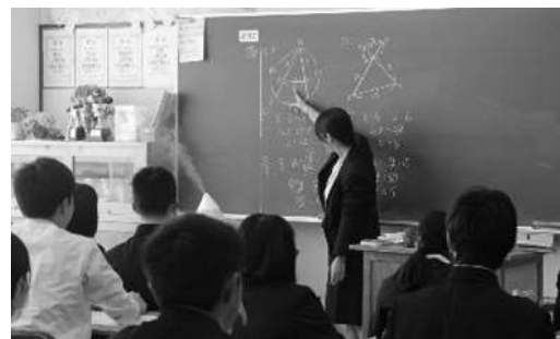
【土曜補習の様子】 全体指導