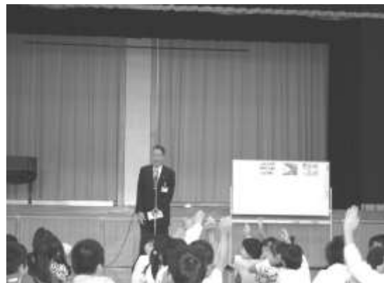
【土曜日寺子屋開講式】