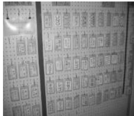
【遊び道具貸出カード】 一目でわかる利用状況