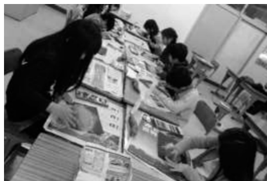
【サツマイモの量感画】