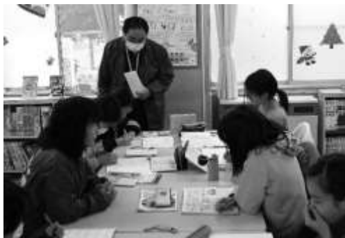
【個々に応じた丁寧な学習指導】 先生が机をまわり、参加者の様子を見守ります。