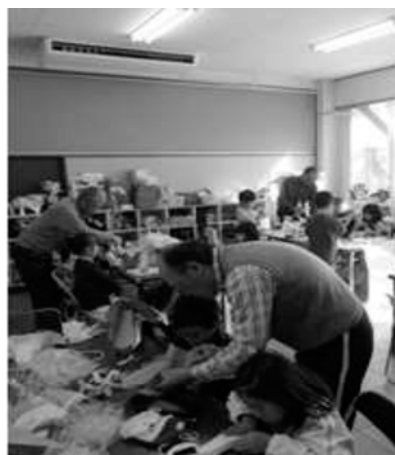
【ダンボールでくつ職人】 履くこともできてみんな大喜びです