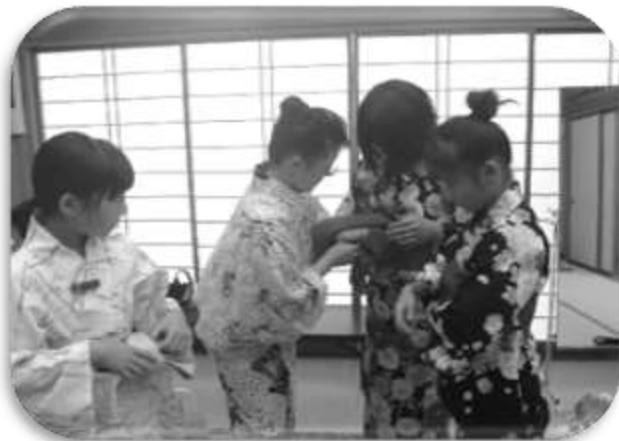
【ゆかた】 着付けの先生に教わりました