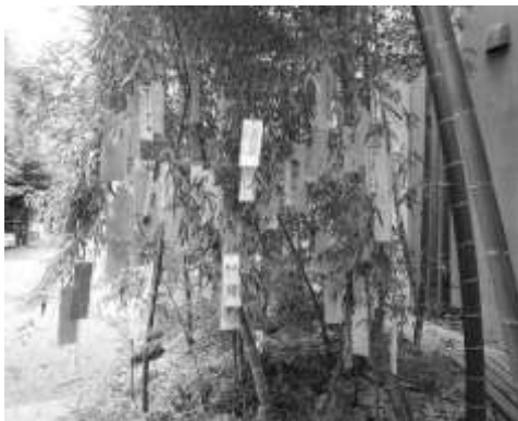
【七夕飾り】 みんなで願いを込めた飾り付け