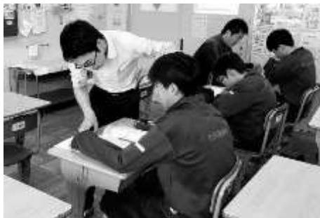
【土曜補習の様子】 個別指導