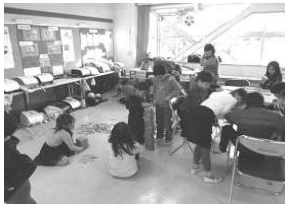
【室内遊びの様子】 昔遊びをしたり、お絵かきをしたり等