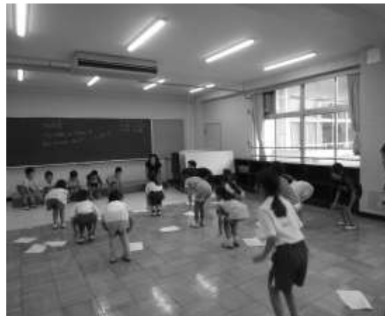
【親子で楽しむ英語】 英語の音楽に合わせてリズム遊び