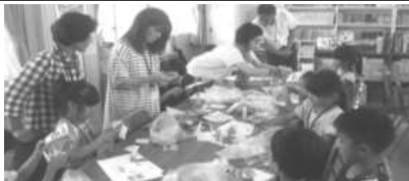
【ものづくり教室】 七夕、ハロウィン、クリスマス、ひな祭りなど季節の行事に合わせた物作り