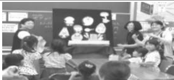
【お話会】 蛍光絵の具で描いた絵が暗闇の中に浮かぶブラックライトシアターなど創意あふれるお話会