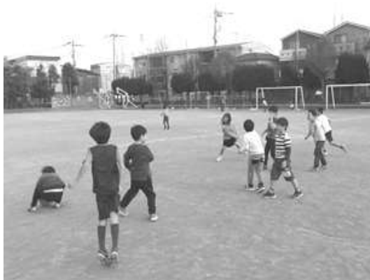
【校庭でボール遊び】 学年関係なくみんなで一緒にドッジボール