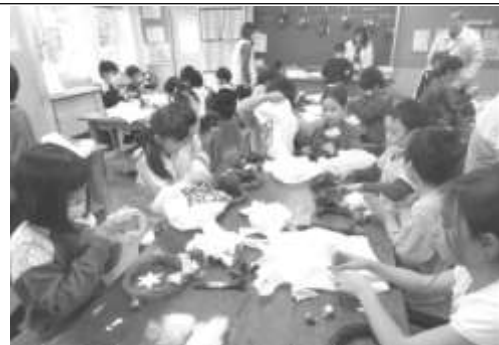
【クリスマスリース作り】