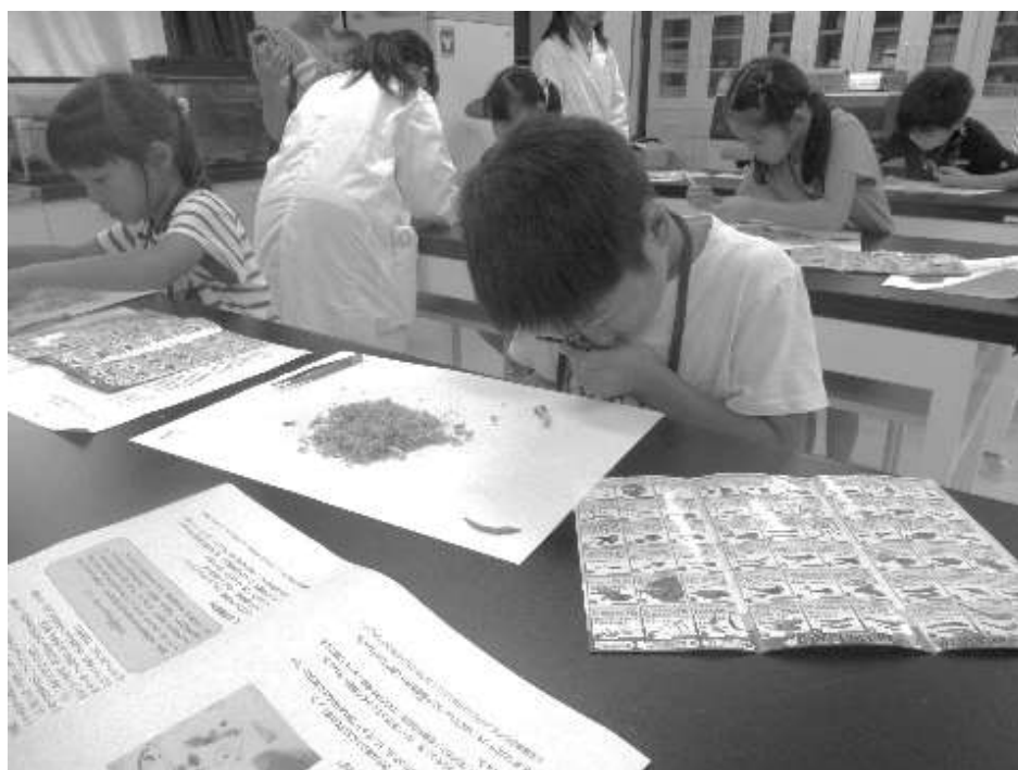
かがく教室 嵐山町放課後子ども教室スイミー