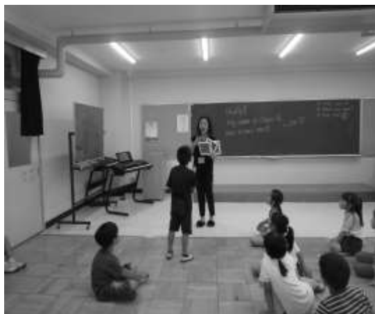
【親子で楽しむ英語】 友達の発表を真剣に聞く児童