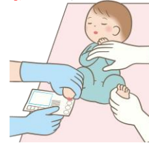
採血の様子 (かかとから採血)