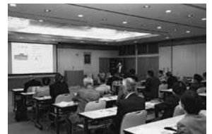
▲共助事例発表会の様子