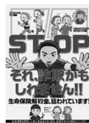
▲詐欺被害防止チラシ