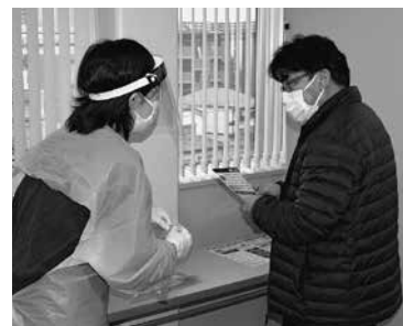
▲販売店による無料PCR検査場