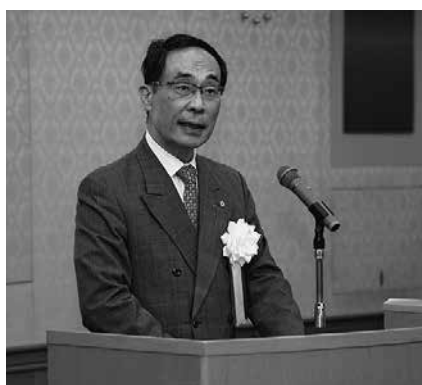
彩の国コミュニティ協議会会長 埼玉県知事 大野 元裕

皆様におかれましては、日頃から環境美化や防災活動などにより、それぞれの地域社会をしっかりと支えていただき感謝申し上げます。