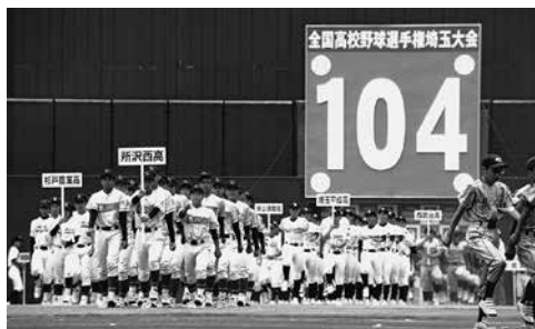
▲高校野球埼玉大会開会式の入場行進

活動は情報発信だけではなくありません。コロナ禍では、さいたま市内の販売店が店舗を無料のPCR検査場として提供しました。グループ全体でこれからも地域の発展に貢献していきたいと考えています。