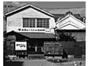
▲足袋とくらしの博物館