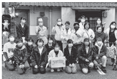
防災訓練集合写真

共助SDGsコバトン記者団は、防災訓練当日の受付準備から炊き出しまで参加し、NPOや企業に対しそれぞれ疑問に思ったことを取材しました。体験活動と取材を通じて、SDGsにおける「パートナーシップ」の志を持って取り組むことの大切さやその重要性を感じられた活動となりました。