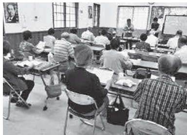
論語教室(令和元年7月の様子)