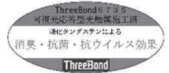
全車両に抗菌・抗ウイルス加工を実施