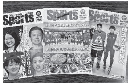
▲年4回発行の広報誌「スポーツ埼玉」は、県内公共施設等へ毎月配布

令和7年2月26日には、創立100年を迎えます。これを契機に116の加盟団体との連携・協力をより一層深め、本県スポーツのさらなる魅力の向上、県民の健康づくりに寄与できるよう努めて参ります。