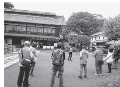
論語の里まち歩きツアー(旧渋沢邸「中の家」)