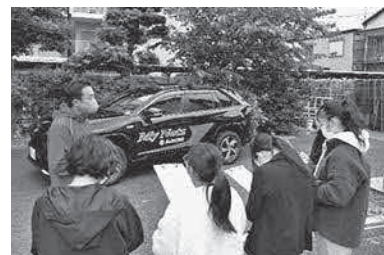
防災訓練取材の様子