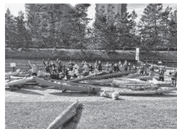
カヌー清掃集合写真

また、今年度の共助SDGsコバトン記者団の活動も随時ホームページ等で情報発信していきますので、ぜひチェックしてみてください。