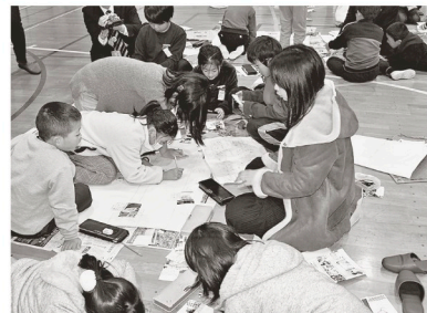
地域安全マップ作製支援