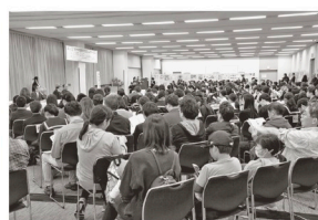
私たちの自然を守ろうコンクール表彰式

これらの活動を支える人材育成の場として、「環境カレッジ」を開催しています。その他、将来を担う子どもたちを対象に、絵画・ポスター・作文による「私たちの自然を守ろうコンクール」も開催しています。今年も36回目を迎えるコンクールは毎年多くの小中学生から応募があり、身近な自然の大切さに気付いてもらうきっかけになっています。また、企業・団体が取り組むSDGs・CSR事業のコーディネートも行っています。