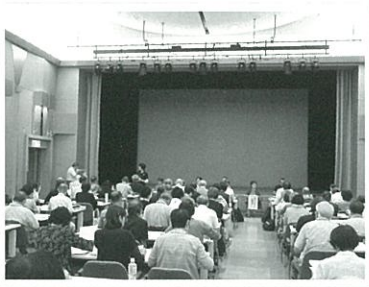
ボランティア入門講座の様子

「ボランティアに興味はあるけれど、何をすればよいのか分からない」。そうした声を受けて、(公財)いきいき埼玉では、社会参加の「きっかけづくり」となる、「いきいきボランティア養成講座」を開催します。