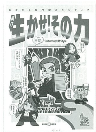
専門家ボランティアリーフレット