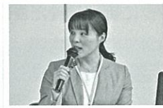
八潮市コミュニティ協議会

団塊の世代の退職によって地域に還元される人材資源の活用と地域コミュニティの宝である「人」がつながるきっかけづくりとして「地域活動入門講座」を実施しました。