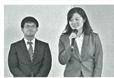
芝園かけはしプロジェクト