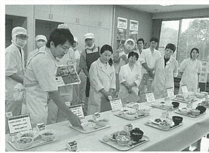
調理コンクールの様子

平成22年7月には、学校給食への理解と学校における食育を支援する施設として、全国的にも初めてとなる「学校給食歴史館」を北本市に開設いたしました。入場無料ですので、児童生徒・学校給食関係者をはじめ、多くの県民の方々のご来館をお待ちしております。