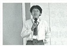
秩父市自治会連合会