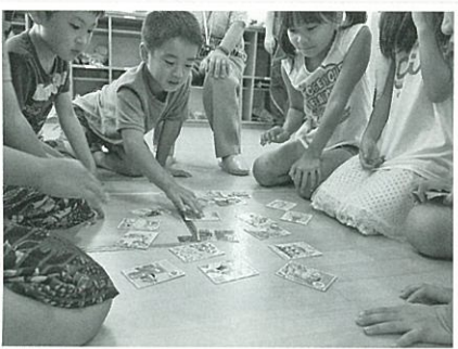
対戦中。真剣な眼差しです。

はじめに、和光市コミュニティ協議会の皆さんから、かるた札の内容について説明がありました。経験豊富な皆さんからの実体験を交えた話に、子供たちからは「行ったことあるけど、そんな場所だったなんて知らなかった」「今度行ってみたい!」などの声があがります。説明の後、3~4人のグループに分かれ、対戦を行いました。札が読み上げられる度、子供たちは一喜一憂。「こんなに札とったよ!」と笑顔を見せていました。