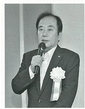
彩の国 コミュニティ協議会会長 埼玉県知事 上田 清司

共助社会づくりのために、「コミュニティ協議会」が果たす役割は大変大きなものです。どうぞこれからも皆様方のお力添えを賜りますようお願い申し上げます。