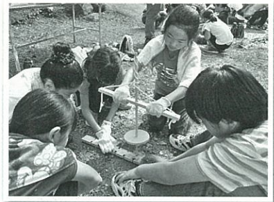
火起こし教室の様子

キャンプファイヤーを行いました。火起こし教室では、初めて見る道具に最初は戸惑いを見せていた子供たちでしたが、終盤にはコツを掴み、無事に火を起こすことができました。