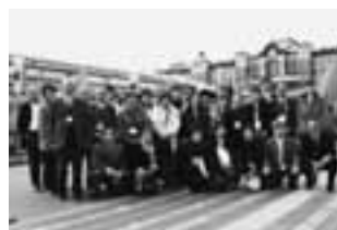
【大勢が参加した視察研修会】

「花」というキーワードは、子どもから高齢者まで幅広い方々に親しみやすいテーマであり、コミュニティ活動の推進には重要な役割を果たすことを改めて実感しています。