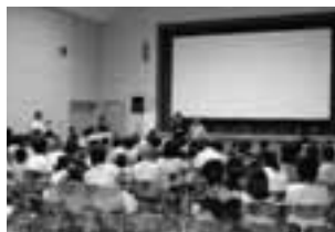
【コミュニティ映画会】

目的に、コミュニティ映画会を開催し「マリと子犬の物語」を上映しました。当日は、前日からの雨が残るあいにくの空模様でしたが、家族連れをはじめ多くの方の来場があり、上映後には感動の涙を流す方もいました。