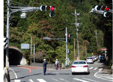
交通規制状況（飯能市側）

※この訓練は、過去に国内で発生したトンネル火災事故を教訓に実施しているものです。