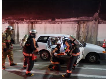
救護活動訓練状況