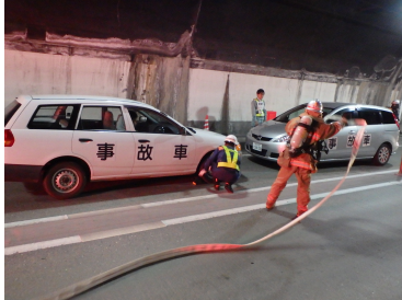
消火活動訓練状況