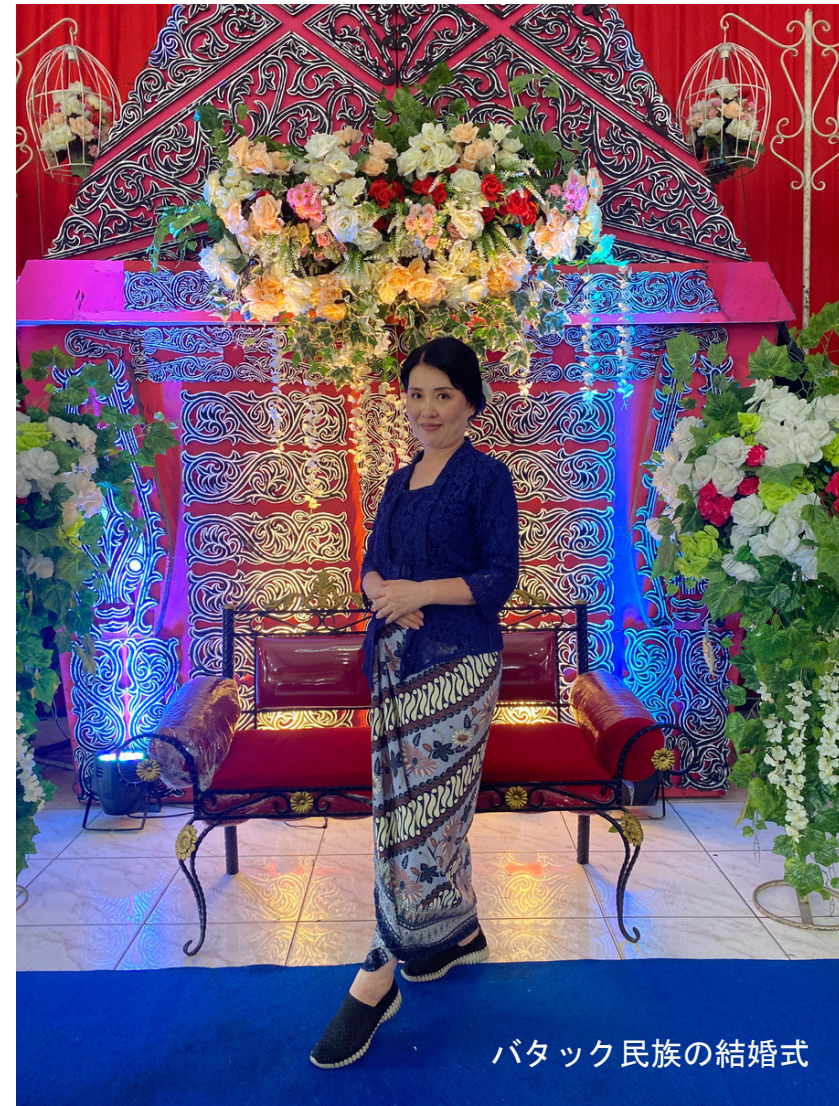
バタック民族の結婚式