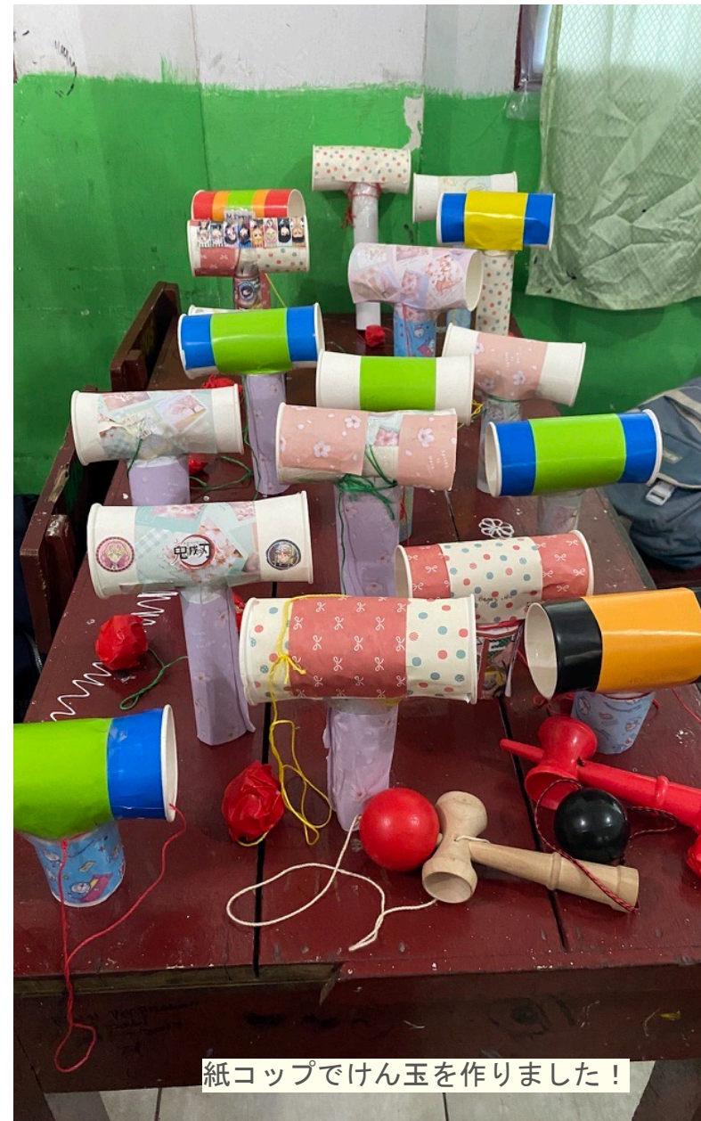
紙コップでけん玉を作りました！