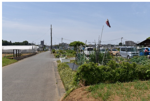
写真 10.13.1-3 No.4 アグリパーク農業体験センター