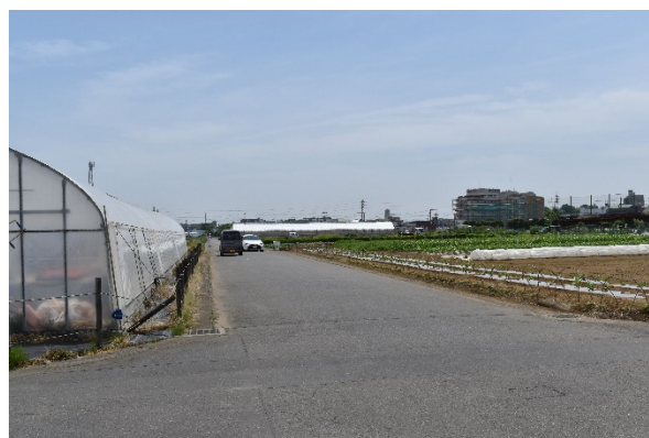
写真 10.13.1-2 No.3 アグリパークコスモス畑