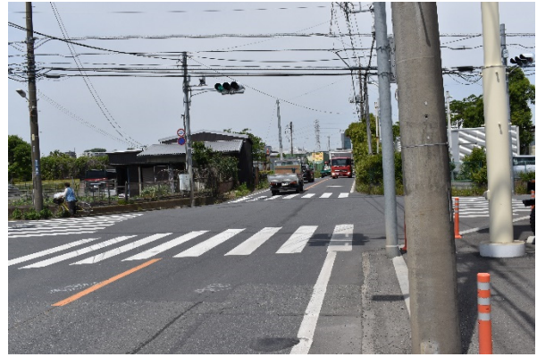
写真 10.13.1-4 水道道路の状況(新倉 8 丁目付近)