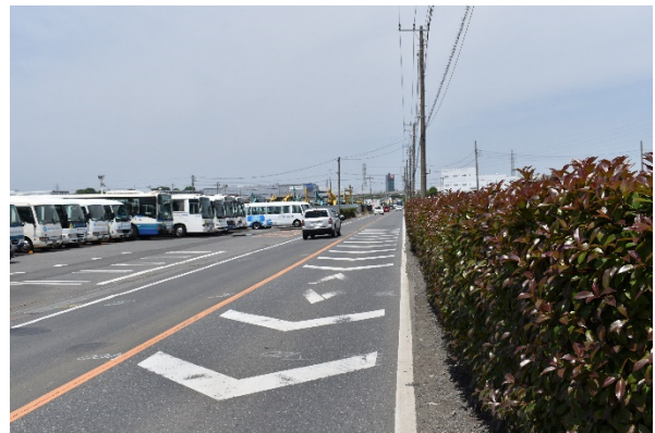
写真 10.13.1-5 水道道路の状況(新倉 3 丁目付近)