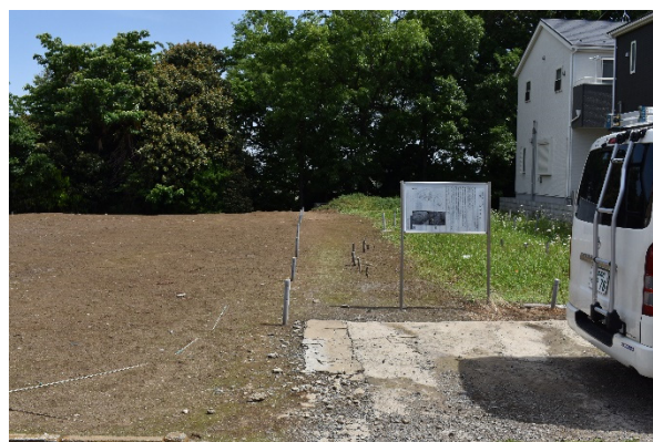
写真 10.13.1-1 No.22 午王山特別緑地保全地区