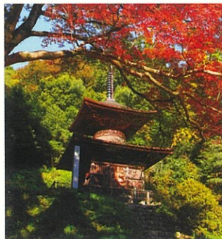
金鑽神社多宝塔 国指定重要文化財

金鑽神社境内にあり、三間四面、柿葺き、高さ約14m、総朱塗り。天文3年(1534年)、武蔵七党で名高い安保弾正全隆が子孫の多幸を祈るために建立したものです。