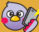
埼玉県マスコット 「さいたまっち」