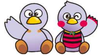
埼玉県マスコット 「コバトン&さいたまっち」

埼玉県公立高等学校入学者選抜の出願、学力検査、入学許可候補者発表の情報に加え、志願者倍率、学力検査得点の閲覧などの情報をお知らせします。