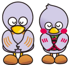
埼玉県のマスコット 「さいたまっち」と「コバトン」